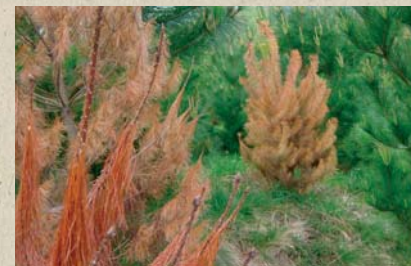
Plantaciones de viña y pino afectadas por la enfermedad

En ocasiones y durante el otoño, se puede observar la fructificación de las setas en la base o la proximidad de los