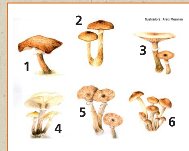
Armillaria cepistipes (2), Armillaria gallica (3), Armillaria mellea (4), Armillaria ostoyae (5), y Armillaria tabescens (6)

En el País Vasco se ha detectado su actividad parásita en plantaciones de coníferas y frondosas, en bosque nativo de diversas especies y en viñedos. Es un hongo muy común y un problema frecuente, probablemente debido a que se trata de un organismo nativo de nuestros bosques que ha continuado su desarrollo en las plantaciones y en los jardines urbanos. Es capaz de colonizar los tocones de árboles y mantenerse vivo en estado saprofito durante varias décadas. En Europa se conocen 6 especies, las 5 últimas ya han sido detectadas en el País Vasco: Armillaria borealis (1),