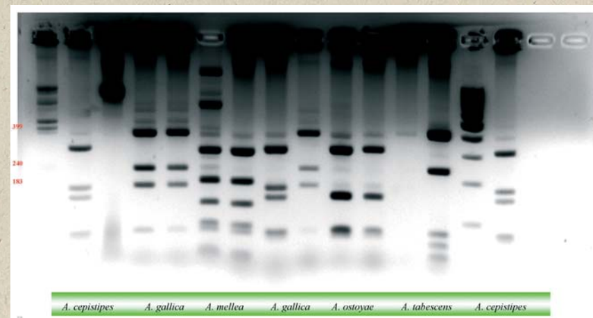
Identificación de las especies mediante técnicas moleculares

En ocasiones y durante el otoño, se puede observar la fructificación de las setas en la base o la proximidad de los