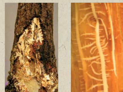
Aspecto del micelio de la Armillaria bajo la corteza del tronco.

Frecuentemente se presentan secreciones de goma o resina en los cuellos de los árboles infectados.