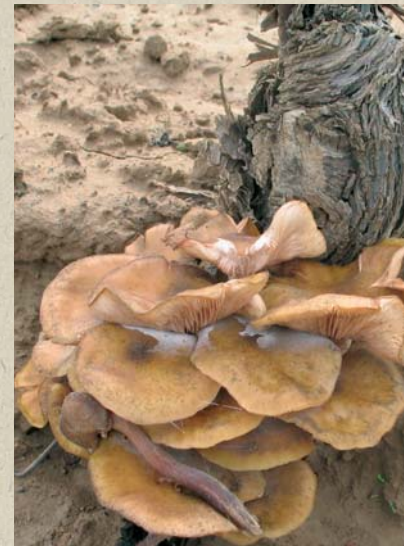
Fructificaciones en la base del tronco de la viña

Al aplicar métodos moleculares (PCR-RFLP), se han detectado 7 patrones correspondientes a 5 especies de Armillaria : A. mellea (tipo 1 y 2), A. ostoyae (tipo 1 y 2), A. cepistipes , A. gallica y A. tabescens .